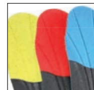
Vario Wide Fit System