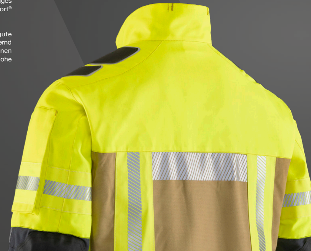
Abb. Fire Recon THL, QA61-A, 816