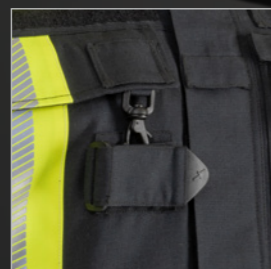
Funkgerätetasche höhenverstellbar, mit seitlichem Reißverschluss