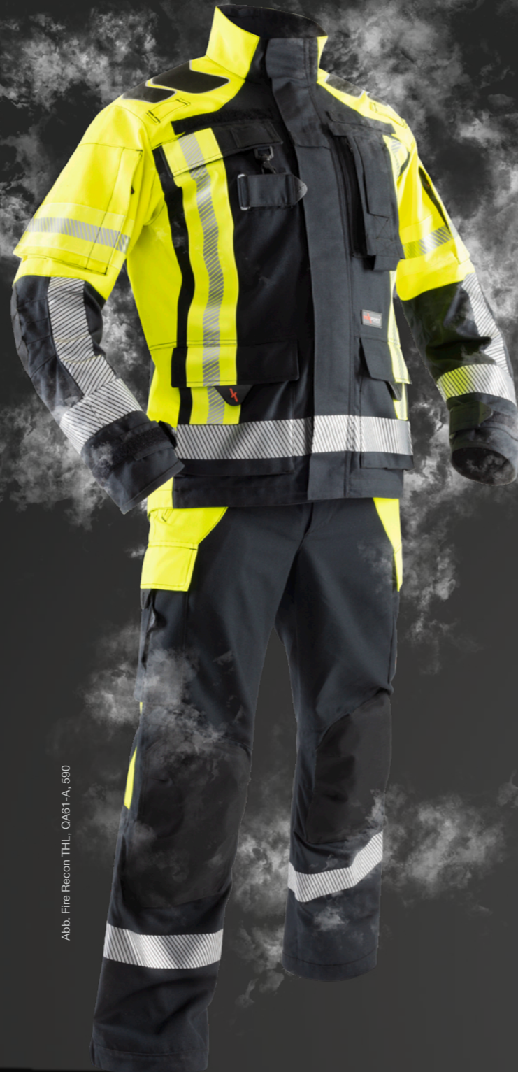
Abb. Fire Recon THL, QA61-A, 590