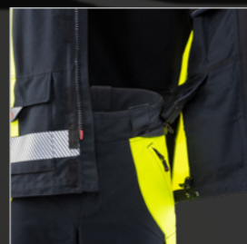
Verbindungsreißverschluss für Jacke und Hose