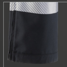
Seitenkeilreißverschluss (SKR) Erleichterte Einstiegsmöglichkeit